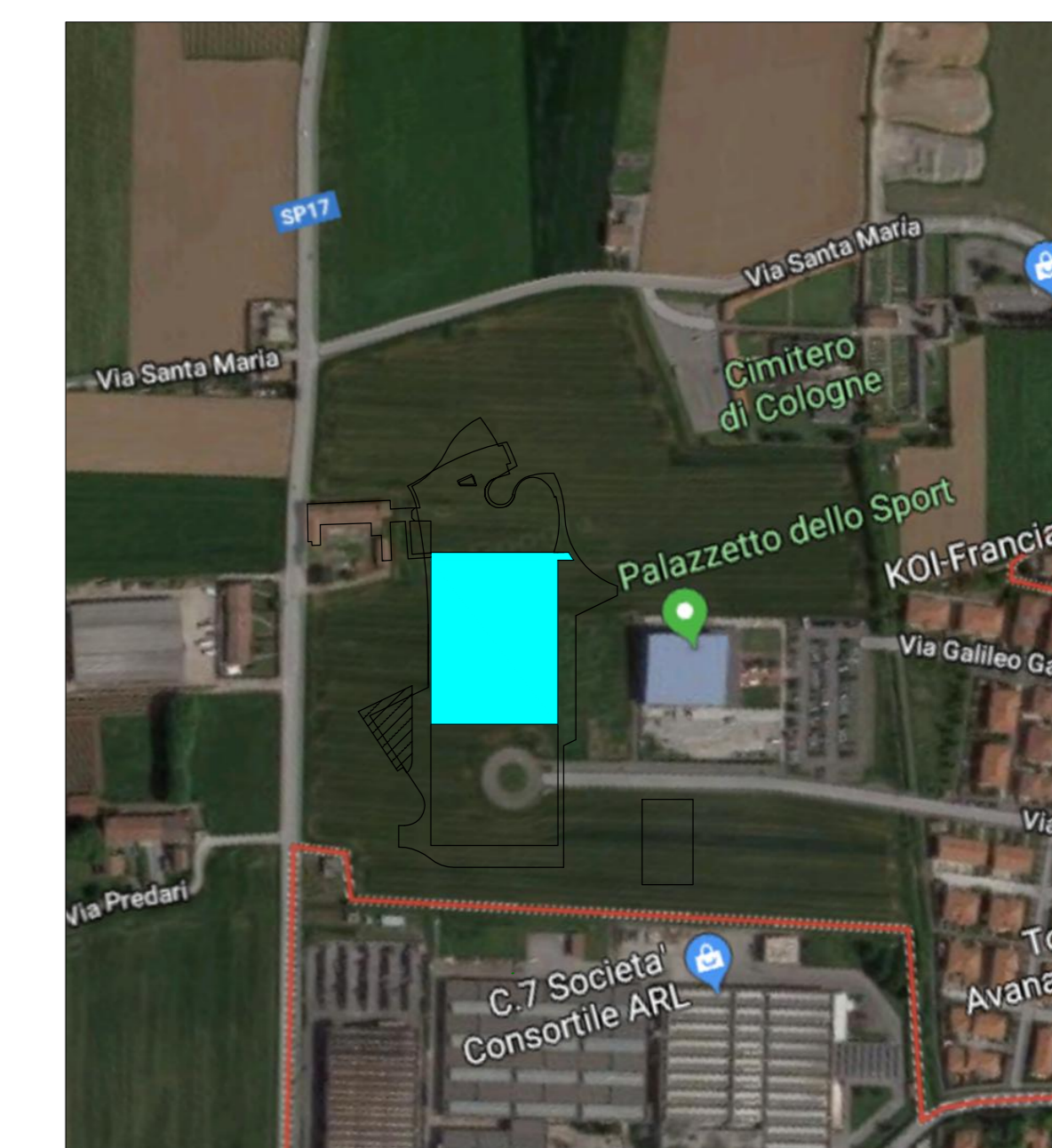
ORTOFOTO - SCALA 1:2000 - Indicazione area reparto produzione