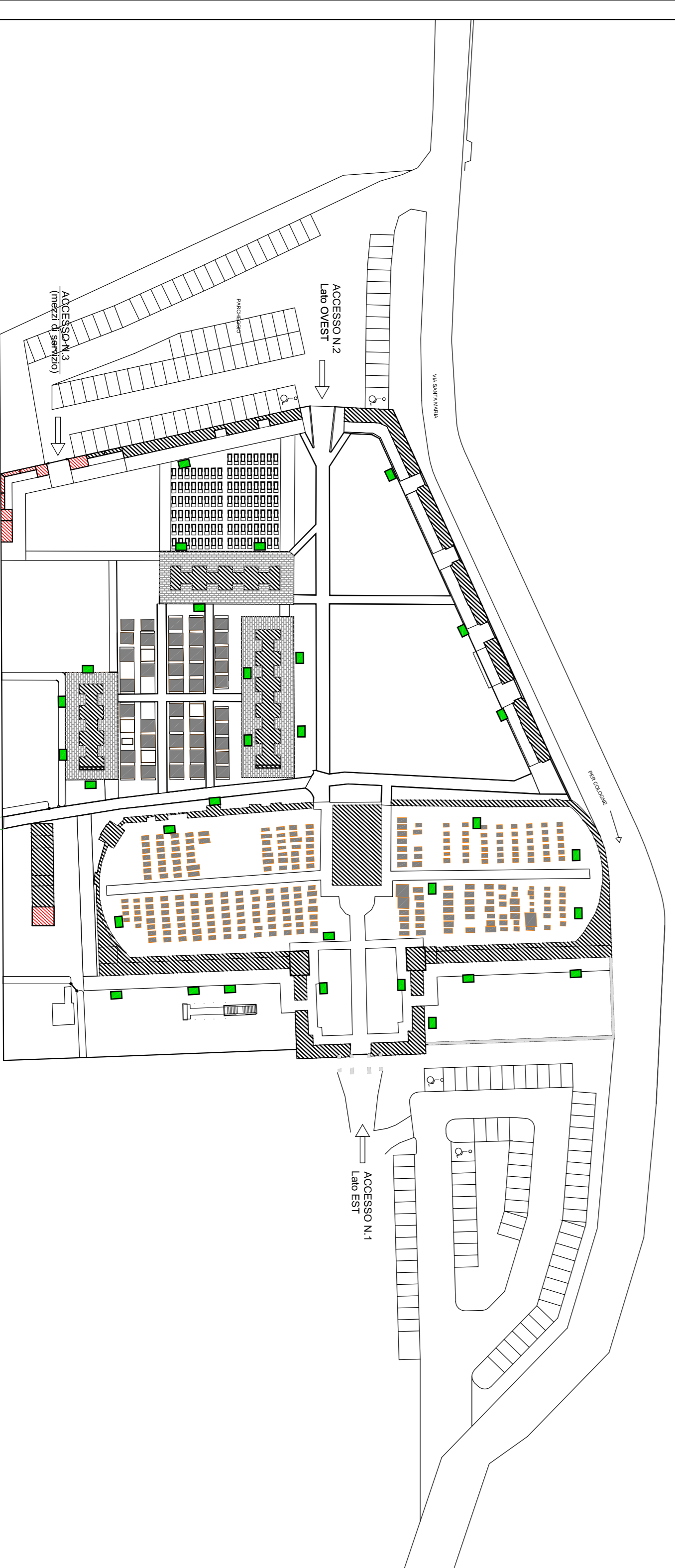
PLANIMETRIA GENERALE CESTINI